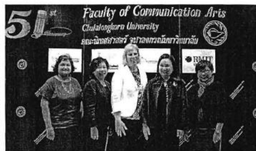
Gregory, centre, the keynote speaker at the symposium titled The Future of Public Relations in the Asia Pacific: Sustainability, Social Responsibility and Social Media.

And last, going back to the first key, communication has been a catalyst to every change that surrounds us today, and without communication organisations don't exist, and neither do societies.