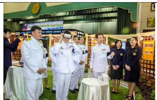
แสดงงานเกษตรแฟร์ ณ อาคารจักรพันธ์

ดูรูปภาพทั้งหมดได้ที่ Google Drive แชร์ กิจกรรมสำนักบริการคอมพิวเตอร์