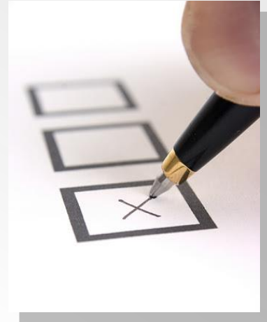
ที่มา : งานทรัพยากรบุคคล (คุณจริยา)

ผู้มีสิทธิเลือก http://e-working.ocs.ku.ac.th/upload/748_2.pdf