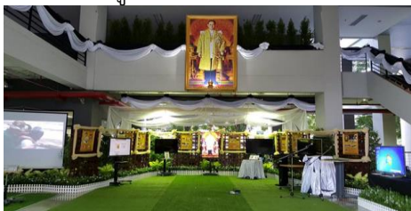
นิทรรศการ จัดบริเวณ ชั้น 1