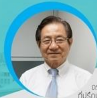
ดร. มนุ อรดีถลเชษฐ์ ที่ปรึกษาปลัดกระทรวงดิจิทัล เพื่อเศรษฐกิจและสังคม