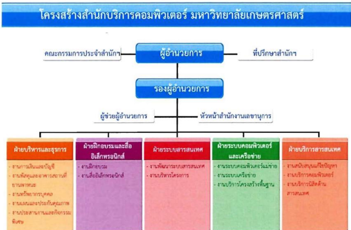
แผนผังโครงสร้างการบริหารองค์กรภายในของสำนักบริการคอมพิวเตอร์

มีแผนผังการจัดโครงสร้างการบริหารและฝ่ายต่าง ๆ ดังแสดงในภาพ