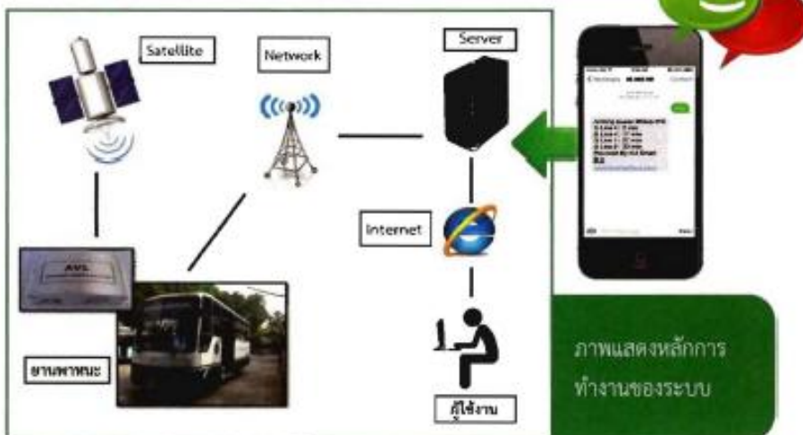
ภาพแสดงหลักการทำงานของระบบ