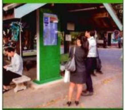
ภาพนิสิตและบุคลากรของมหาวิทยาลัยที่ได้ให้ความสนใจจอแสดงผลรายงานเวลาเข้าสู่ป้ายของรถโดยสารสวัสดิการ