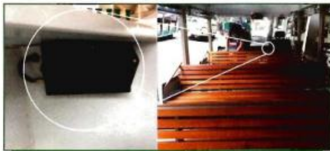
ภาพอุปกรณ์ GPS ที่ได้ทำการติดตั้งบนรถโดยสารสวัสดิการ

ภายหลังจากการเปิดให้ใช้งานได้อย่างเต็มรูปแบบ ตั้งแต่เดือนตุลาคม พ.ศ. 2556 จนกระทั่งปัจจุบัน ผลปรากฏว่ามีนิสิต อาจารย์ บุคลากรภายในมหาวิทยาลัยและบุคคลภายนอกได้ให้ความสนใจในระบบการแจ้งข้อมูลการเดินทางรถโดยสารสวัสดิการ มาก เป็นจำนวนมาก โดยผู้ใช้งานระบบสามารถติดตามข่าวสารหรือมีข้อเสนอแนะให้กับทางทีมงานได้ทาง Facebook Fanpage KUSmartBus ซึ่งระบบนี้สามารถนำไปประยุกต์ใช้ได้กับระบบการขนส่งมวลชนในพื้นที่อื่นได้ เช่นกัน ตัวอย่างเช่น Shuttle Bus ที่วิ่งระหว่างโรงแรมและสนามบิน รถที่วิ่งภายในศูนย์แสดงนิทรรศการ ตลอดจนรถประจำทางสายต่างๆ ในกรุงเทพมหานครได้อีกด้วย