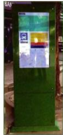
ภาพจอแสดงผลที่ติดตั้งตามป้ายหยุดรถโดยสาร

หลักการทำงานของระบบดังกล่าว ประกอบไปด้วย 3 ส่วน คือ ส่วนเก็บข้อมูลการเดินทางด้วยเทคโนโลยี GPS ส่วนนี้จะทำหน้าที่บันทึกข้อมูลการเดินทาง ได้แก่ พิกัด เวลา และความเร็วในการขับขี่ของรถโดยสาร โดยอุปกรณ์ GPS ซึ่งจะส่งข้อมูลพิกัดและความเร็วไปยังเซิร์ฟเวอร์ (Server) ที่ใช้ในการประมวลผลผ่านการสื่อสารแบบ 3G จากนั้น ส่วนประมวลผลจะเป็นส่วนรับข้อมูลจากส่วนแรก โดยนำข้อมูลตำแหน่งและความเร็วรณมาใช้ในการประมวลผลว่ารถสวัสดิการคันดังกล่าวจะมีระยะเวลาเดินทางไปยังป้ายถัดไปได้ภายในอีกกี่นาที และส่วนสุดท้ายคือ ส่วนรายงานผล จะทำการรายงานผลระยะเวลาในการรอตโดยสารที่ป้ายและระยะเวลาในการเดินทางไปยังจุดหมายใน 4 ช่องทาง คือ การแจ้งผลผ่านทางแอปพลิเคชันบนมือถือสมาร์ทโฟน ระบบการรายงานผลผ่านทาง SMS จอแสดงผลที่ติดตั้งตามป้ายหยุดรถโดยสารหลักและทางเว็บไซต์ www.kusmartbus.com โดยออกแบบให้มีความทันสมัยและใช้งานง่าย เพื่ออำนวยความสะดวกแก่ผู้ใช้งานระบบ