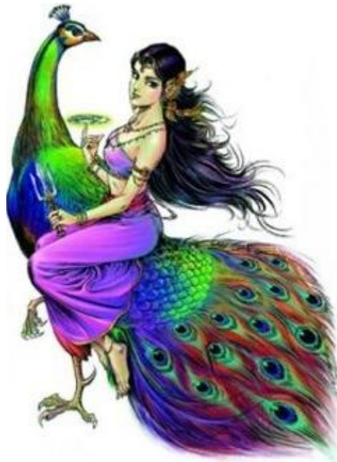
คำทำนาย นางสงกรานต์ ปี พ.ศ. 2556

วัน มหาสงกรานต์ปี 2556 ตรงกับวันเสาร์ที่ 13 เมษายน 2556 นางสงกรานต์นาม "มโหธรเทวี" ทรงพาหุรัดทัดดอกสามหาว อาภรณ์แก้วนิลรัตน์ ภักษาหารเนื้อทราย พระหัตถ์ขวาทรงจักร พระหัตถ์ซ้ายทรงตรีศูล เสด็จไสยาสน์หลับเนตร (นอนหลับตา) มาบนหลังมยุรา (นกยูง)