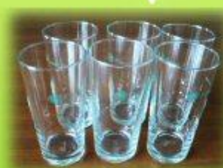
แก้วน้ำใสทรงสูง ราคา 230 บาท