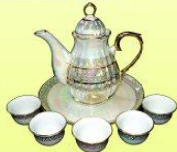
กาชาวมุก ราคา 1,200 บาท