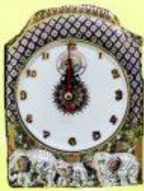
นาฬิกาเบญจรงค์ ราคา 1,450 บาท