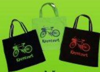
กระเป๋าผ้าแคนวาส ราคา 90 บาท