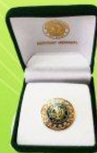
เข็มตรามหาวิทยาลัยสิงคโปร์ ราคา 200 บาท