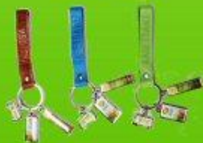
พวงกุญแจสายหนัง ราคา 90 บาท

มีจำหน่ายที่ ศูนย์หนังสือมหาวิทยาลัยเกษตรศาสตร์ บาทเจน Tel.02-942-8063-7 ต่อ 127 Fax.02-579-9597 วิทยาเขตศรีราชา Tel.038-354580-6 ต่อ 2696 www.kubook.ku.ac.th