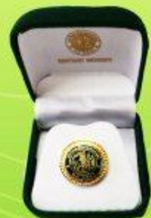
เข็มตราวิทยาลัย ราคา 75 บาท