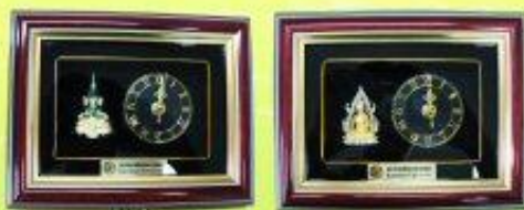
กรอบนาฬิกาฉายพระ 2 แบบ ราคา 999 บาท