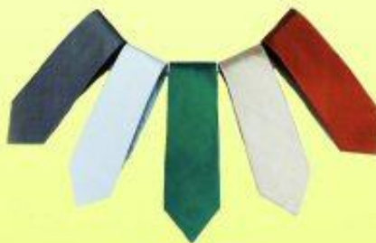
เนคไทไหม 100% ราคา 650 บาท