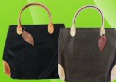
กระเป๋าผ้ามูหนัง ราคา 150 บาท