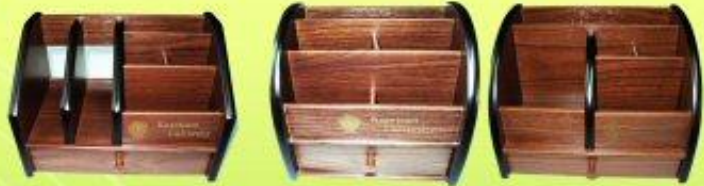
กล่องไม้ ราคา 320 บาท