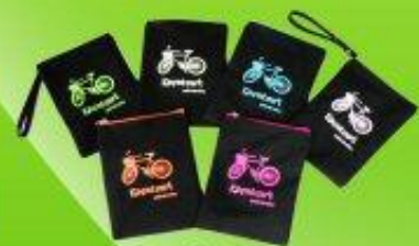
กระเป๋าดินสอ ราคา 29 บาท