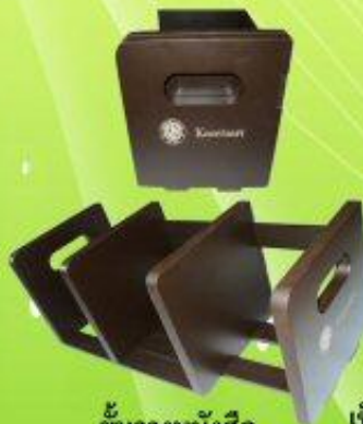
ชั้นวางหนังสือ ราคา 280 บาท