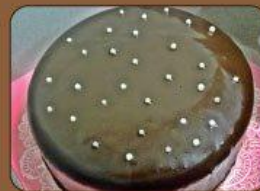
Chocolate Fudge Cake