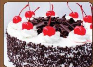
Black Forest Cake