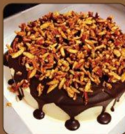
Coffee Almond Cake