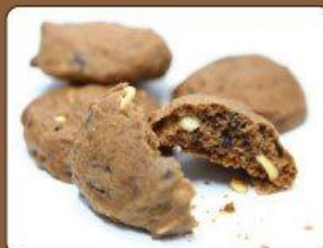
Chocolate Chip cookies Oaty Cookies Coffee Almond Cookies