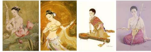
ปีพุทธศักราช ๒๕๔๑ สำนักพิพิธภัณฑสถานและวัฒนธรรมการเกษตร จัดพิมพ์บัตรอวยพรชุด "หญิงไทยกับวัฒนธรรม" จำนวน ๘ ภาพ