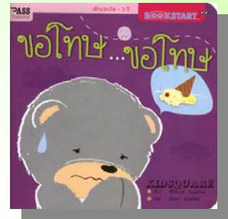
ขอภัยไม่ใช่หน้าปกหนังสือจริง