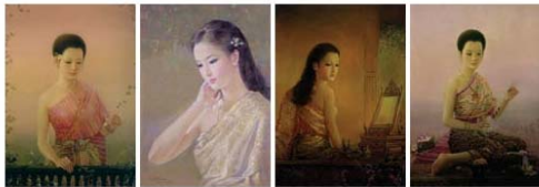
ในปีพุทธศักราช ๒๕๔๓ สำนักพิพิธภัณฑสถานและวัฒนธรรมการเกษตร จัดพิมพ์บัตรอวยพรชุด "สีสันตราครุฑไทย" จำนวน ๘ ภาพ