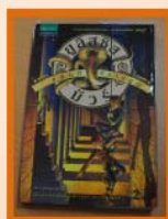
รางวัลที่ 3