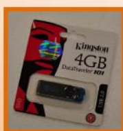
รางวัลที่ 1