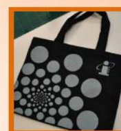
รางวัลที่ 5