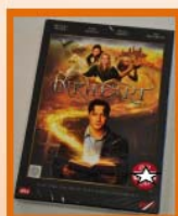
รางวัลที่ 2