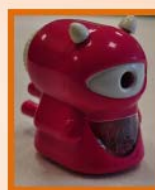
รางวัลที่ 4