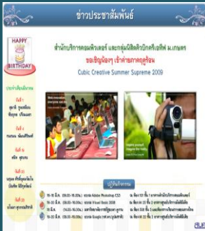
ข่าวประชาสัมพันธ์ผ่านจอพลาสมา