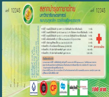
สลากบำรุงสภากาชาดไทย มก.

ขอเชิญบุคลากร นิสิตและผู้สนใจ ซื้อสลากบำรุงสภากาชาดไทย ของมหาวิทยาลัยเกษตรศาสตร์ รายได้ทั้งหมดสมทบทุนมูลนิธิเกล้าฯ ถวายโดยเสด็จพระราชกุศล ในราคาฉบับละ 100 บาท