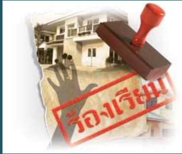
การอุทธรณ์และร้องทุกข์

สำหรับท่านที่ต้องการค้นหาระเบียบ/ข้อบังคับอื่น ๆ งานสารบรรณได้นำขึ้นไว้ที่เว็บ private.ocs.ku.ac.th หัวข้อระเบียบ/ข้อบังคับ โดยภายในได้แยกเป็นระเบียบของแต่ละงานเช่น งานบุคคล งานพัสดุ งานการเงิน