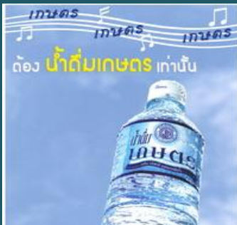
น้ำดื่มเกษตร

คณะกรรมการการศึกษาและประชาสัมพันธ์จะทำการคัดเลือกและแจ้งรายชื่อผู้มีสิทธิเข้าร่วมโครงการฯ เป็นรายบุคคลไปยังหน่วยงานต้นสังกัด หากสละสิทธิไม่สามารถใช้สิทธิแทนกันได้