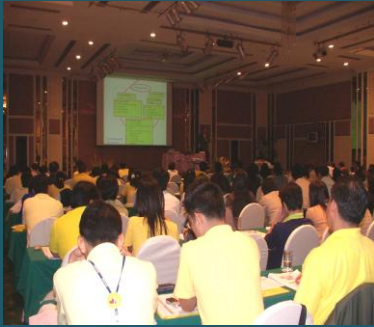
โครงการสัมมนาสมาชิกสอ.มก.