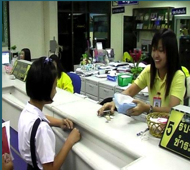
การปรับอัตราดอกเบี้ยเงินฝาก

สหกรณ์ออมทรัพย์มหาวิทยาลัยเกษตรศาสตร์ แจ้งการปรับปรับอัตราดอกเบี้ยเงินรับฝาก ตามมติที่ประชุมคณะกรรมการบริหารการเงิน ครั้งที่ 4/2552 เมื่อวันที่ 12 มีนาคม 2552 เพื่อให้สอดคล้องกับการเปลี่ยนแปลงอัตราดอกเบี้ยเงินฝากของธนาคารพาณิชย์ ดังนี้