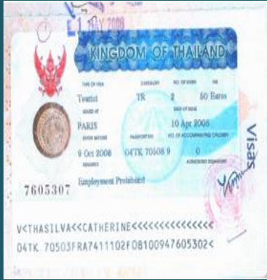
ยกเว้น Visa ประเภทนักท่องเที่ยว