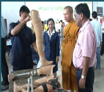
ขาเทียมแบบเหนียว

สามารถสั่งซื้อได้ตั้งแต่วันที่ 2 มี.ค. 2552 เป็นต้นไป ทุกวันจันทร์-เสาร์ เวลา 08.30-16.30 น. ติดต่อที่คุณเสด็จวรรณ อิมสุดใจ ฝ่ายการตลาดผลิตภัณฑนม โทร. 0-2579-9594 ต่อ 101-103 โทรสาร 0-2579-1876 ต่อ 108