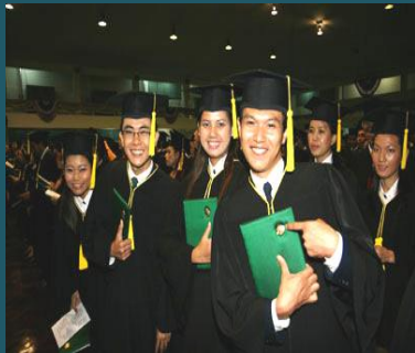
ทุนการศึกษาของทุนพัฒนา มก.