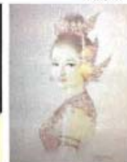
จันทกินรี

สนใจติดต่อสั่งซื้อได้ที่..สำนักพิพิธภัณฑฯและวัฒนธรรมการเกษตร