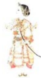
พราหมณ์เกศสุริยง

และภาพกามเทพ จากเพลงพระราชนิพนธ์ "เทวพาตุผิน"