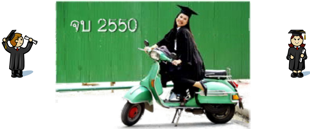
สำนักบริการคอมพิวเตอร์ มหาวิทยาลัยเกษตรศาสตร์